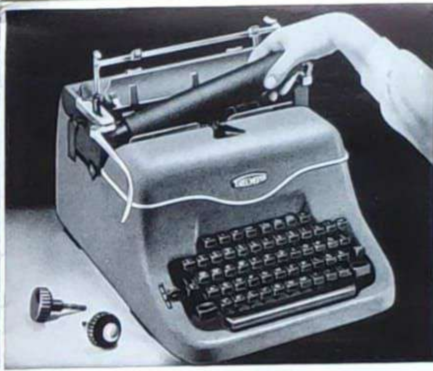
Die Schreibwalze kann nach Abschrauben der Walzendrehknöpfe herausgenommen und gegen eine weichere (leiser Anschlag) oder eine härtere (viele Durchschläge) ausgetauscht werden.