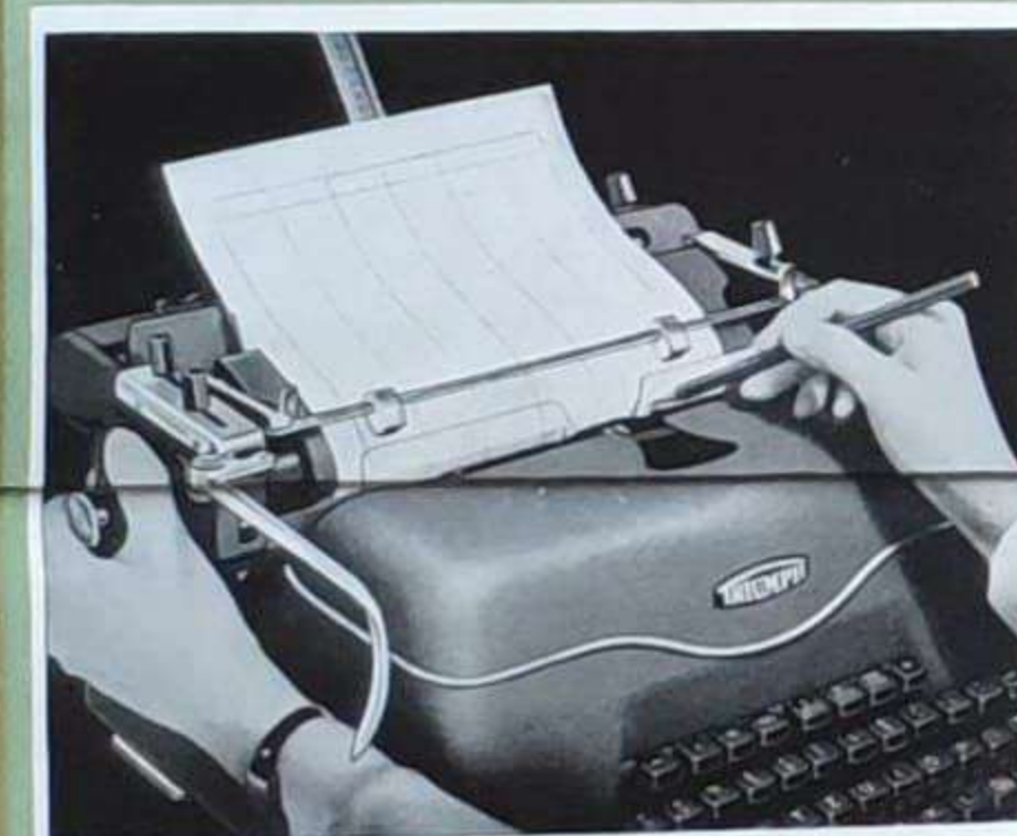
Formulare können einfach und schnell mit der Schreibmaschine angefertigt werden. In den Zeilenrichtlinien befinden sich zu diesem Zweck Löcher, die als Stützpunkt für den Bleistift beim Ziehen senkrechter und waagrechter Linien dienen.