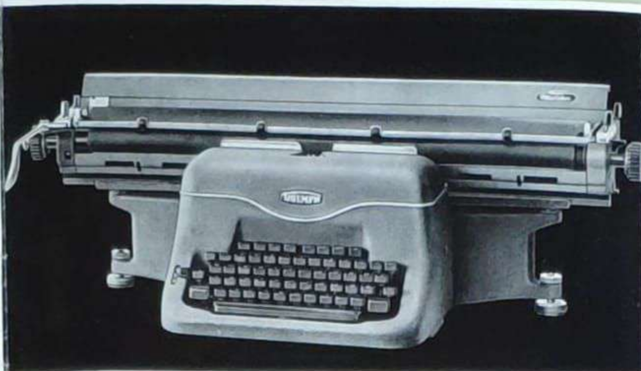
Vier verschiedene Wagengrößen bis zu 62 cm Walzenlänge können auf jede Grundmaschine aufgesetzt werden.