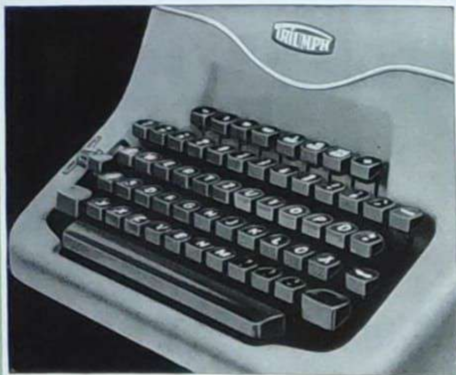
Klare, übersichtliche Anordnung des Tastenfeldes. Blendfreie Kunstharz-tasten, deren Griffflächen schaufelartig gestaltet, d. h. der Form der Fingerspitzen angepaßt sind.