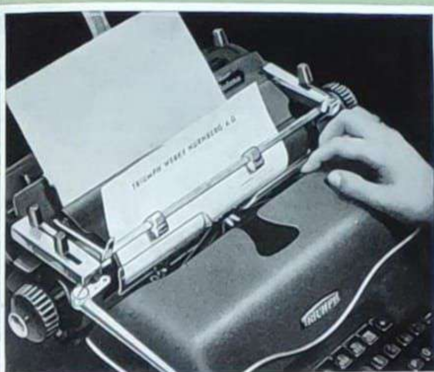
Durchsichtige Zeilenrichtlinien dienen zum Ausrichten des Bogens und zum Auffinden der Schreibzeile und der Buchstabenmitte. Das Erscheinen des Bogenendes ist durch das Glas sichtbar. Das Abklappen der Linien ermöglicht ein bequemes Radieren, auch auf der untersten Zeile.