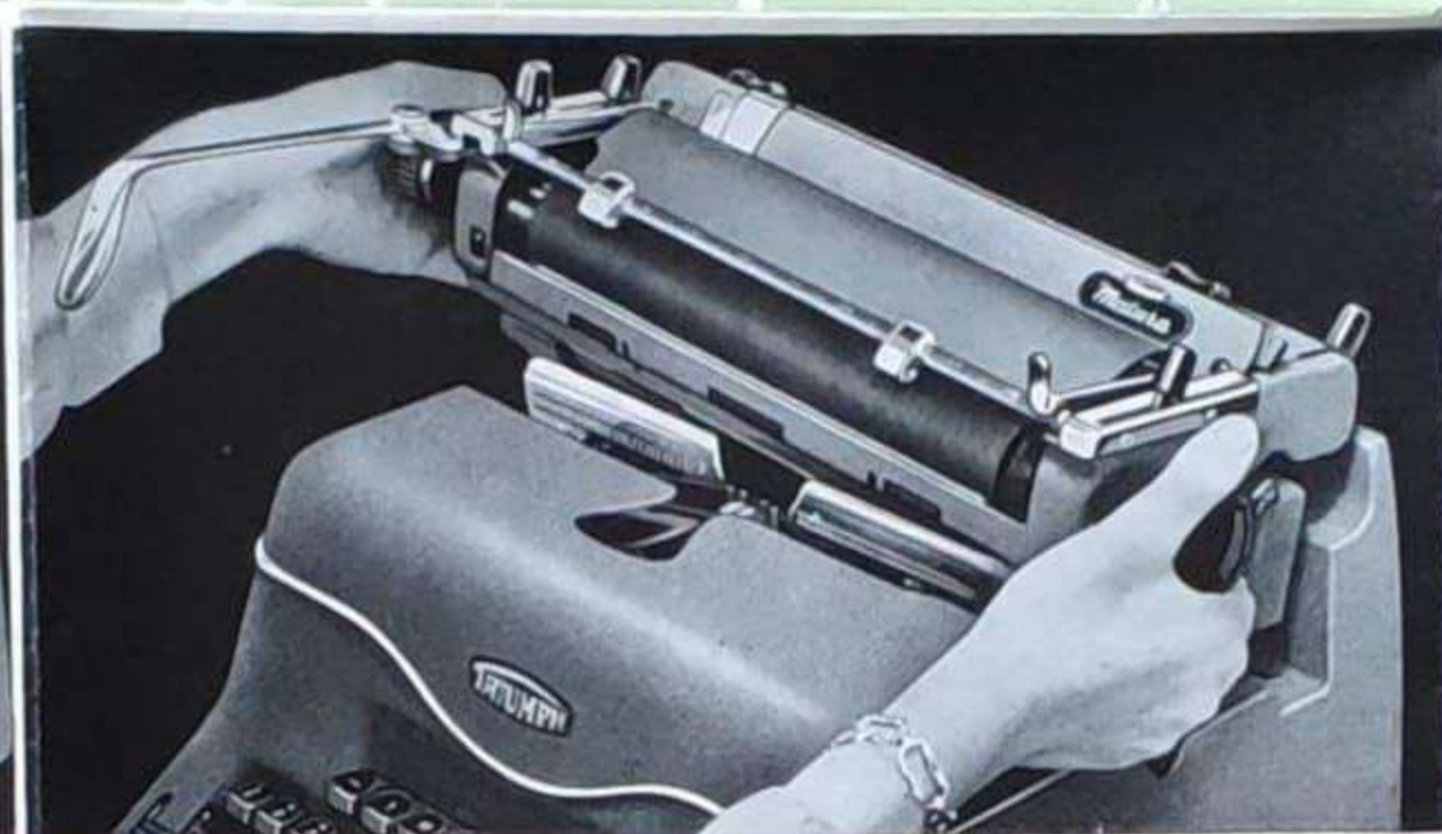
Wenige Handgriffe genügen, um den Wagen mühelos und in Sekunden schnelle abzunehmen und aufzusetzen.