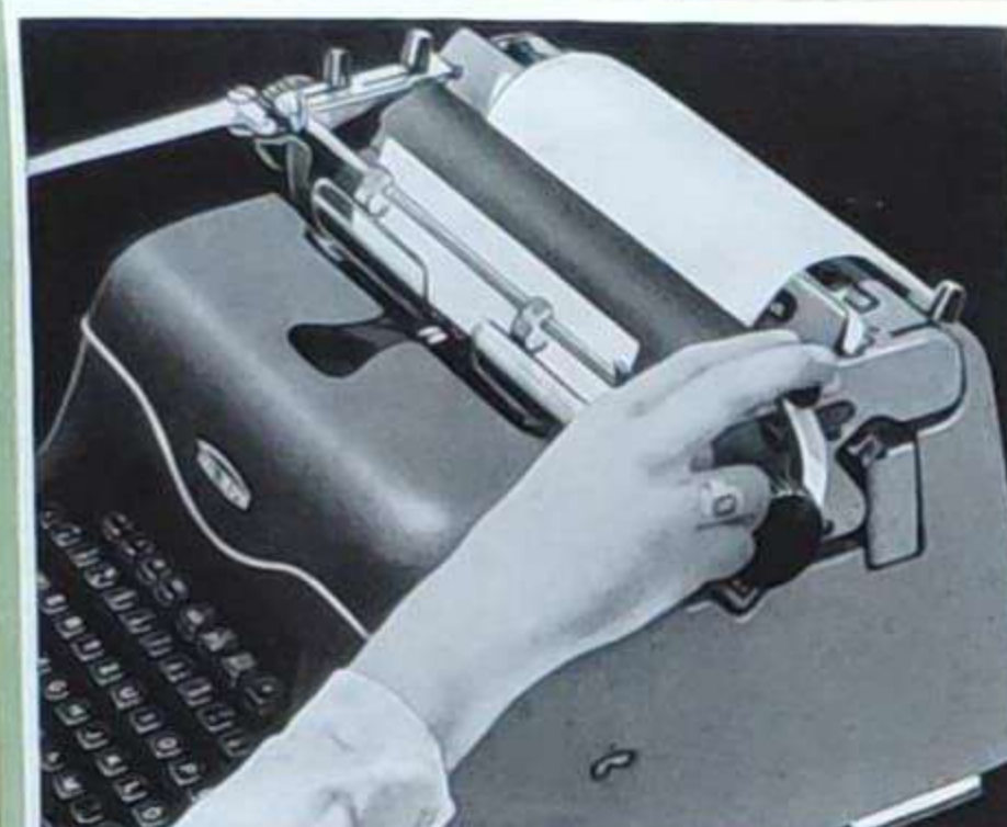
Der Einzugshebel, der auf besonderen Wunsch angebracht wird, führt den Briefbogen in einem Zug unter die Papierhalteschiene und wirft den beschriebenen Bogen in gleicher Weise aus.